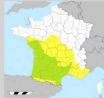
Figure 2 : Répartitions de la Genette commune en France métropolitaine 2008 (ONCFS (Wikipédia)) Jaune : zone de présence irrégulière Vert : zone de présence régulière.