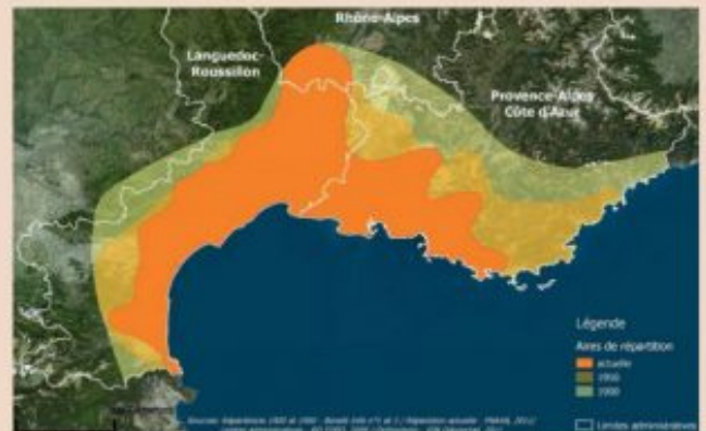
Figure 1 : Évolution de la répartition française de l'Aigle de Bonelli entre 1950 et 2014