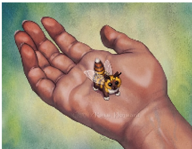
Figure 3: Chabeille mâle en phase de socialisation. L'animal est habituellement très farouche.

Le chabeille ressemble à un insecte, mais ne possède que 2 paires de pattes, munies de coussinets et de griffes rétractiles. Il a de fines antennes lui permettant de repérer ses proies, et des oreilles orientables pour une précision maximale. Sa queue touffue lui permet de stabiliser son vol, et se hérisse quand l'animal est surpris ou effrayé. Il n'y a pas de dimorphisme sexuel.