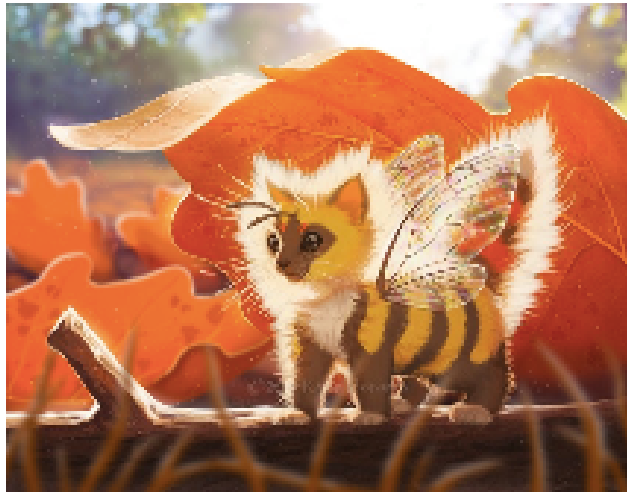
Figure 1: Chabeille femelle (fausses couleurs) observé sur son lieu de repos habituel, une branche de feuillu